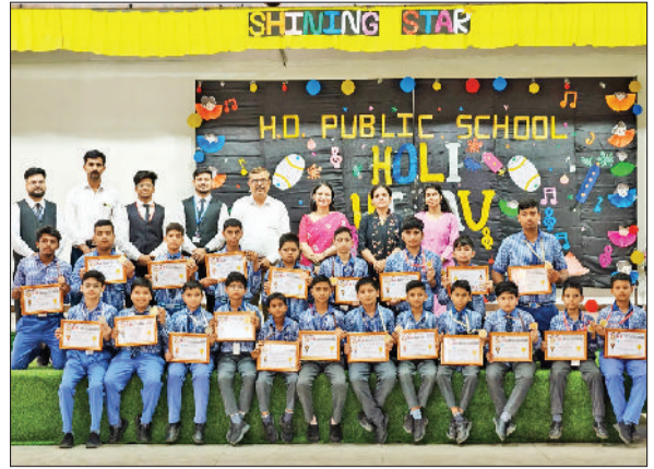
चरखी दादरी। विद्यार्थियों को सम्मानित करते स्कूल प्रबंधक।

इस दौरान विशेष रूप से आईसीडीएस विभाग, स्वास्थ्य विभाग (सीएचसी गोपी) तथा अन्य विभागों के स्टॉल लगाए गए थे, जिनके माध्यम से आमजन को विभागों के कार्यप्रणाली और स्वास्थ्य सेवाओं के बारे में जानकारी प्रदान की गई। कार्यक्रम में स्थानीय उद्यमियों और स्वयं सहायता समूहों ने भी बड़े-चढ़े भागीदारी की। हाट में प्रमुख रूप से संगवान शॉप इंस्ट्रूज, नेकीराम फूड, एसआरएस फूड, उद्यान विभाग और अंबुजा फाउंडेशन के अलावा कई स्वयं सहायता समूहों ने अपने स्टॉल लगाए। इनमें ज्योति स्वयं सहायता समूह तथा जय माँ स्वयं सहायता समूह की महिलाओं ने अपने द्वारा तैयार किए गए घरेलू उत्पाद, खाद्य सामग्री तथा हस्तनिर्मित वस्तुओं का प्रदर्शन किया। इस प्रकार के आयोजनों से ग्रामीण महिलाओं को स्वरोजगार के अवसर मिलने के साथ-साथ उनके आत्मविश्वास और आर्थिक सशक्तिकरण को भी बढ़ावा मिलता है।