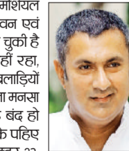
शिवानी। हरियाणा सहित आसपास के इलाकों में कर्मशियल एलपीजी सिलेंडर की भारी किल्लत ने आम जनजीवन एवं व्यापार की कमर तोड़ दी है। स्थिति इतनी विकल हो चुकी है कि अब इसका असर केवल होटलों तक सीमित नहीं रहा, बल्कि अस्पतालों के बाइर लाइन वाले भंडार और खलिहानों के हॉस्टल तक पहुंच गया है। सख्त दुःखद तस्वीर माता मनसा देवी न्यू भंडारा हॉल से सामने आई है, जो पूरी तरह बंद हो चुका है। यहां से संचालित होने वाली 14 मेडाइल टैगों के पहिए धम धम हैं। ये वैन रोजाना पीजीआई चंडीगढ़ सेक्टर-32 सेक्टर-16 और पंचकुला सेक्टर-6 जैसे बंद अस्पतालों में करीब 7 हजार लोगों को मुफ्त भोजन पहुंचाती थी। चौधरी ने बतया कि सिलेंडर नहीं होने के कारण अब इन मरीजों के तीमारदारों और गरीबों के सामने भोजन का संकट खड़ा हो गया है। वहीं हॉस्टल में रह रहे खिलाड़ियों के लिए भी खान बनाना मुश्किल हो गया है। अब मजदूरों ने घरेलू सिलेंडरों का जुगाड़ किया जा रहा है, जो अवैध एवं असुरक्षित है। संकट का फायदा उठाकर कालाबाजारी करने वाले खलिहान हो गए हैं, अब घरेलू गैस सिलेंडर तीन हजार तक में बलैक में बेचा जा रहा है।

चरखी दादरी। उपयुक्त डॉ. मुनीश नागपाल ने कहा कि समाज को नशे के दुष्प्रभाव से बचाने के लिए जागरूकता और सख्त कार्रवाई बेहद जरूरी है। उन्होंने अधिकारियों को निर्देश दिए कि युवाओं व बच्चों के बीच वाह्य मुक्ति अभियान चलाकर उन्हें जागरूक किया जाए। उपयुक्त ने पुलिस प्रशासन को आदेश दिए कि नशा बेचने वालों पर लगातार छापेमारी कर सख्त कार्रवाई की जाए और किसी भी तरह की हिलाई न बरती जाए। उपयुक्त ने ये निर्देश जिला स्तरीय एनर्जेट कमेटी की बैठक की अध्यक्षता करते हुए दिए। उन्होंने शिक्षा विभाग और खेल विभाग को आदेश दिए कि वे विद्यालयों व कॉलेजों में जागरूकता कार्यक्रम आयोजित करें और खेल गतिविधियों के माध्यम से युवाओं को नशे से दूर रखने के प्रयास तेज करें। उन्होंने पुलिस प्रशासन को भी निर्देश दिए कि नशील पदार्थ बेचने वालों पर लगातार छापेमारी की जाए और दोषियों के खिलाफ सख्त से सख्त कार्रवाई सुनिश्चित हो।