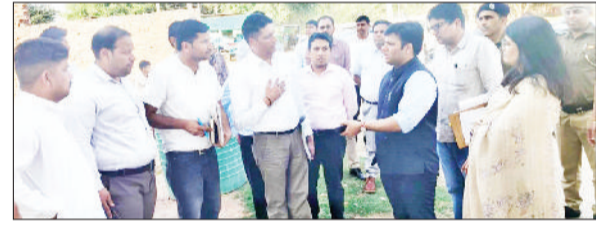
मिवाणी। निरीक्षण के दौरान अधिकारियों को दिशा निर्देश देते हुए।