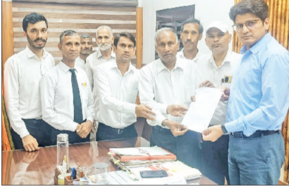
मिवाणी। अधूरे रोड पर टोल चालू करने के विरोध में ज्ञापन देते हुए।