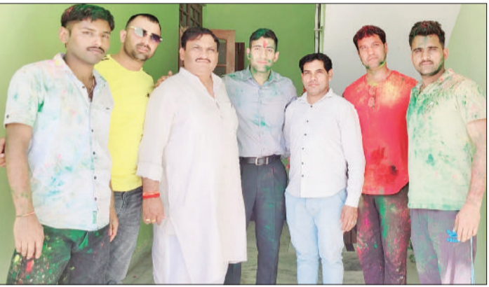
तोशाम। फ्लाइंग ऑफिसर के पहचान पर स्वागत करते हुए।