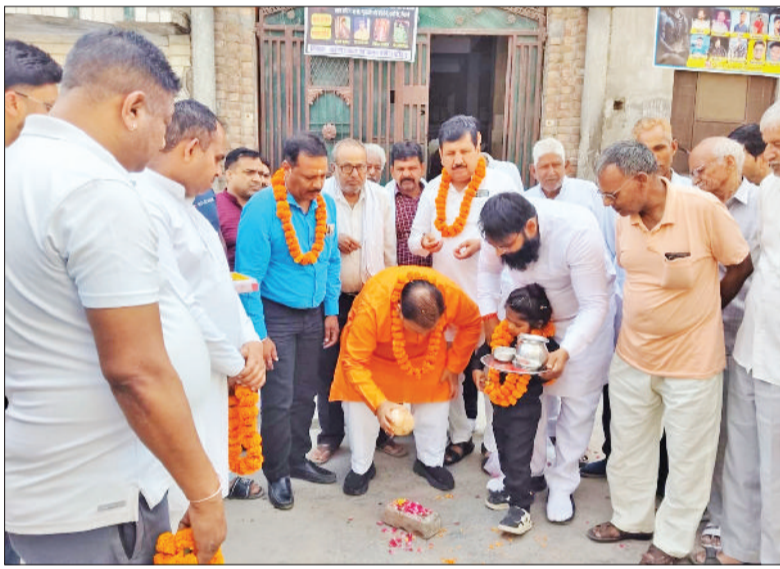
मिवाणी। नारियल फोड़कर विकास कार्यों का शुभारंभ करवाते हुए।